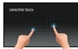
Tecnologia tattile - PCAP

I display IPS sono noti soprattutto per gli ampi angoli di visione e i colori naturali e precisi. Sono particolarmente adatti per applicazioni critiche dal punto di vista del colore.